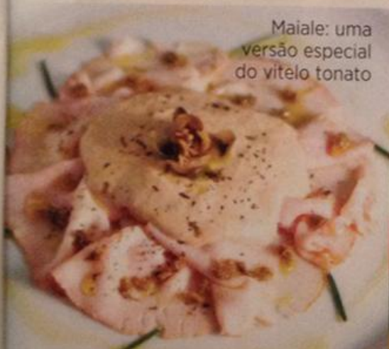
Maiale: uma versão especial do vitelo tonato