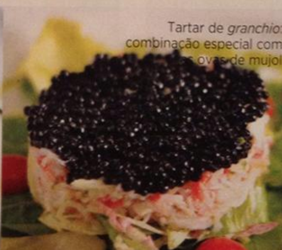
Tartar de granchio : combinação especial com ovas de mujol